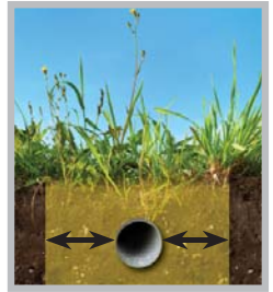
Tolerance Zone (refer to enclosed state-specific insert)

Even the most minor damage to a pipeline can have serious consequences. If you cause or witness even minor damage to a pipeline or its protective coating, do not cover up or attempt to repair the pipeline. Evacuate the area and call 911 and the pipeline company immediately.