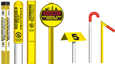
From left to right: TriView™ Marker, Dome Marker, Flat Marker, Round Marker, Aerial Marker, Casing Vent Markers.

Markers are located in the pipeline right-of-way and indicate the approximate location, but not the depth, of a buried pipeline.