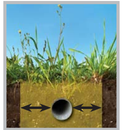
Zona de Tolerancia (haga referencia al inserto incluido con información específica de su estado)

Aun un daño menor a la línea de tuberías puede tener consecuencias severas. Si usted ocasiona o evidencia cualquier daño, por leve que sea, a una línea de tuberías o a su capa protectora, no tape ni intente reparar la línea de tuberías. Evacúe el área y llame inmediatamente al 911 y a la compañía de la línea de tuberías.